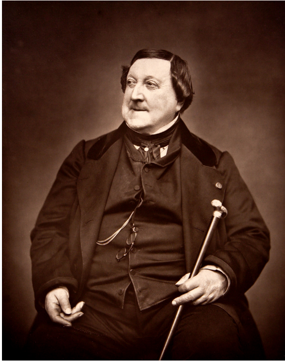
Gioachino Rossini, Fotografie von 1865

Kochleidenschaft und entwickelte sich zu einem Gourmet und auch Gourmand. Manche Gerichte trugen ihm zur Ehre seinen Namen.