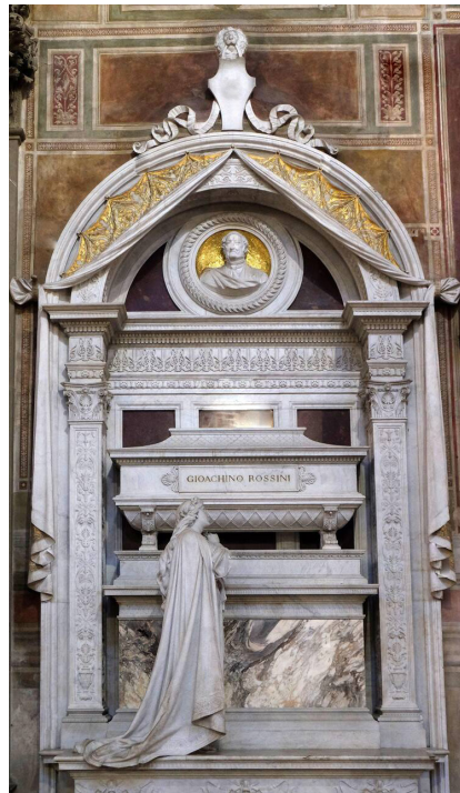
Grabmal in der Basilika Santa Croce Florenz.