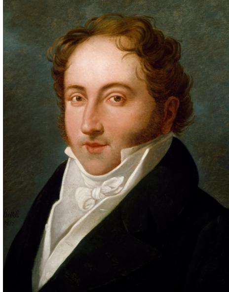
Gioachino Rossini, Portrait von 1818

Unser heutiger Komponist, Gioachino Rossini, ein Schaltjahrskind, wurde am 29. Februar 1792 in Pesaro in Italien geboren und wuchs in einer Musikerfamilie auf. Bei festlichen Anlässen machte der Knabe mit seiner hellen Sopranstimme früh auf sich aufmerksam. Wie schon Joseph Haydn blieb auch Rossini, dank des energischen Eingreifens der Mutter, einer Sängerin, das Schicksal eines Sängerkastraten erspart. 1804 hatte der Zwölfjährige seinen ersten öffentlichen Auftritt gemeinsam mit seiner Mutter; vor Begeisterung über seine schöne Stimme nannte man ihn in seiner Jugend Schwan von Pesaro . Nach dem Umzug nach Bologna besuchte er dort ab 1806 das Liceo Musicale . Seine Ausbildung umfasste Komposition, Gesang und das Spiel von Klavier, Horn und Violoncello. Mit seiner Mutter hatte er mehrere Auftritte als Sänger. Für seine Leistungen als Sänger wurde er durch die Aufnahme in die Accademia Filarmonica di Bologna geehrt. In diesen frühen Jahren verfasste er bereits zwei Sinfonien, einige Arien, Bläservariationen und eine erste Oper. Ein glänzendes Debüt als Opernkomponist gelang ihm 1810 mit La cambiale di matrimonio in Venedig.